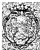
COMUNE DI FORZA D'AGRO