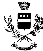
COMUNE DI CASALVECCCHIO SICULO.

Piazza Giovanni XXIII n°1 - C.A.P. 98030 - Forza D'Agro (ME)