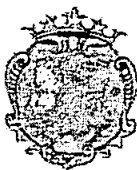
COMUNE DI FORZA D'AGRO'