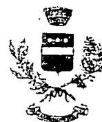
COMUNE DI CASALVECCCHIO SICULO.

Piazza Giovanni XXIII n°1 - C.A.P. 98030 - Forza D'Agro (ME)