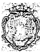
COMUNE DI FORZA D'AGRO'