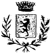
COMUNE DI ROCCAFIORITA-