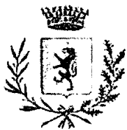
COMUNE DI ROCCAFLORITA-