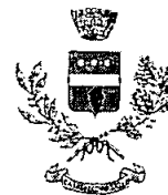
COMUNE DI CASALVECCCHIO SICULO.

Piazza Giovanni XXIII n°1 - C.A.P. 98030 - Forza D'Agrò (ME)