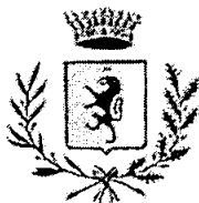
COMUNE DI ROCCAFORTITA-