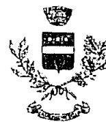
COMUNE DI CASALVECCCHIO SICULO.

Piazza Giovanni XXIII n°1 - C.A.P. 98030 - Forza D'Agrò (ME)