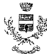
COMUNE DI CASALVECCCHIO SICULO.

Piazza Giovanni XXIII n°1 - C.A.P. 98030 - Forza D'Agrò (ME)