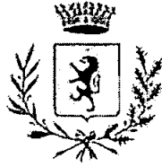
COMUNE DI ROCCAFIORTA-