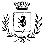
COMUNE DI ROCCAFIORITA-