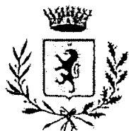
COMUNE DI ROCCAFIORTA-