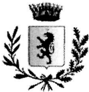
COMUNE DI ROCCAFIORITA-